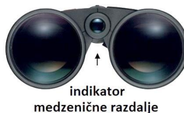
Slika 4: Zenična razdalja

Razdalja med zenicama se od človeka do človeka razlikuje. Da bi dosegli optimalno nastavitev, daljnogled držite v položaju za opazovanje in obe polovici daljnogleda premikajte navzven ali navznoter (Slika 4), dokler pri pogledu skozi oba okularja ne zagledate samo eno okroglo sliko. Tako je daljnogled pravilno nastavljen za zenično razdaljo vaših oči.